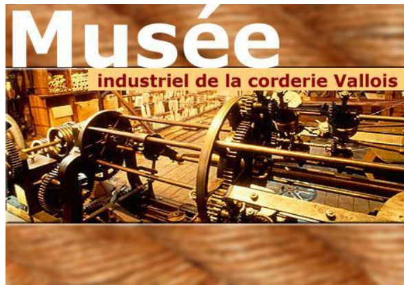
Musée de la Corderie de Vallois