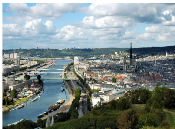
La ville de Rouen