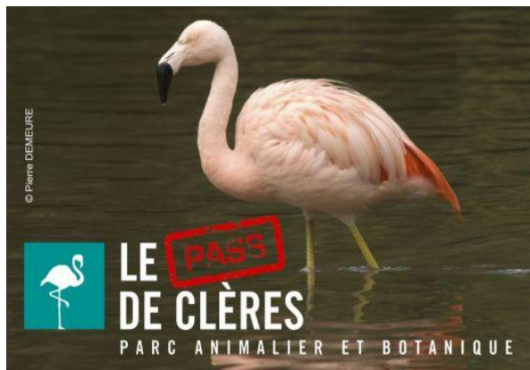
Parc de Clères

☛ Sur réservation auprès du CDSMR76 au 02.35.33.52.57 avant le 13 Mai 2017