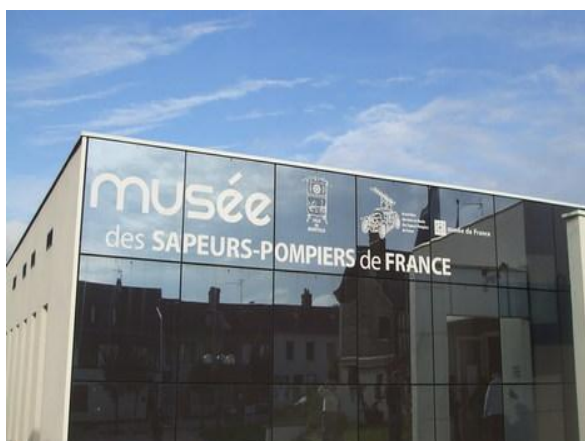
Musée des Sapeurs Pompiers de Montville